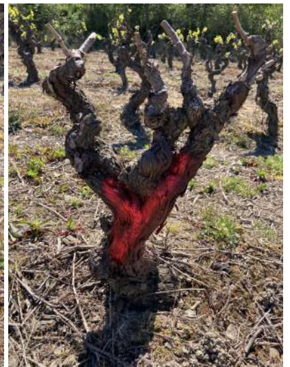
Cep rebombé après contrôle arrachage