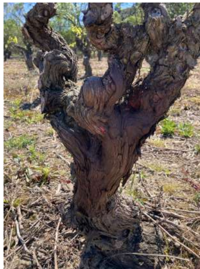
Cep non arraché, peinture grattée

En plus des traitements insecticides obligatoires, l'élimination des bois de taille, l'épamprage, l'arrachage des souches infectées et des vignes ensauvagées, sont des moyens permettant de limiter l'expansion et l'installation de la cicadelle vecteur de la flavescence dorée.