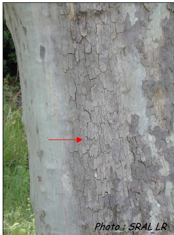
Ecorce craquelée restant adhérente. Pas de réaction cicatricielle.

N.B. : les flammes sont plus visibles en brumisant de l'eau sur les troncs.