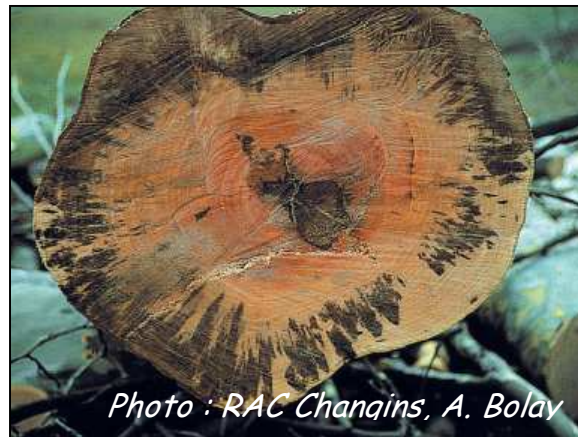
Coupe transversale d'un tronc : la présence du champignon entraîne une coloration du bois.